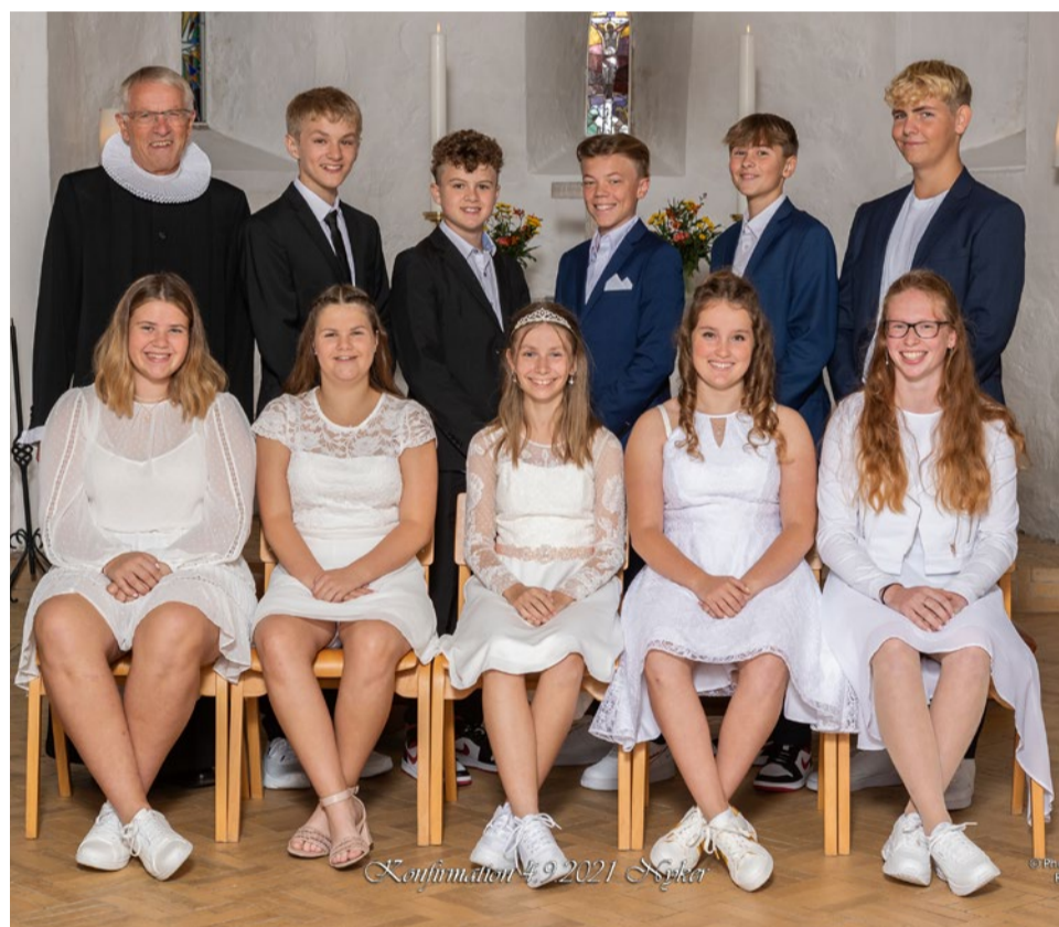
Årets konfirmationer blev festlige begivenheder. 4 blev konfirmeret i maj måned og 10 i september måned.