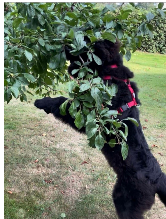
37 kilos ren kærlighed – på jagt efter blommer!