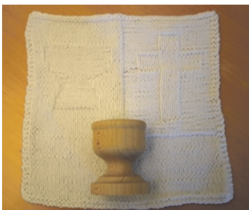
Dåbslysestage og dåbsklud som bliver givet ved dåb i Ny Kirke.

19. april kl. 10.30 1. s. e. påske Finn Kappelgaard Indsamling: Dansk Bibel Institut