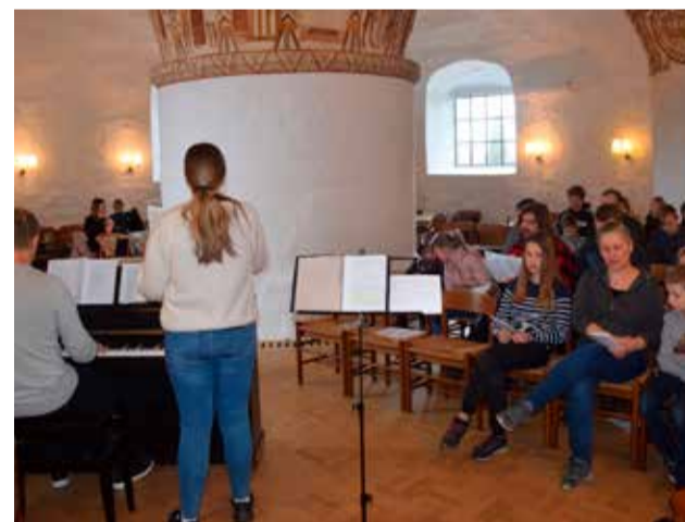
Ungkirke i Ny Kirke. Sangen fylder meget ved gudstjenesten.